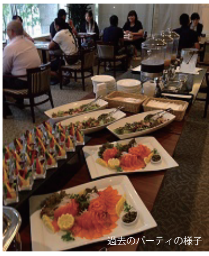
過去のパーティの様子